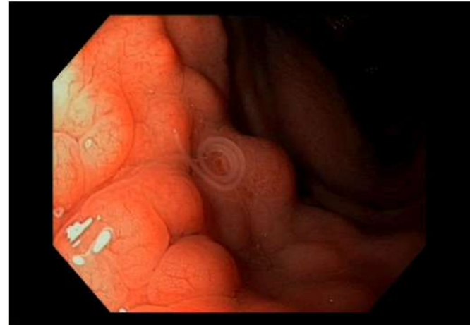
Fig. 1. Endoscopia que muestra Helicobacter pylori alojado en la cámara gástrica.